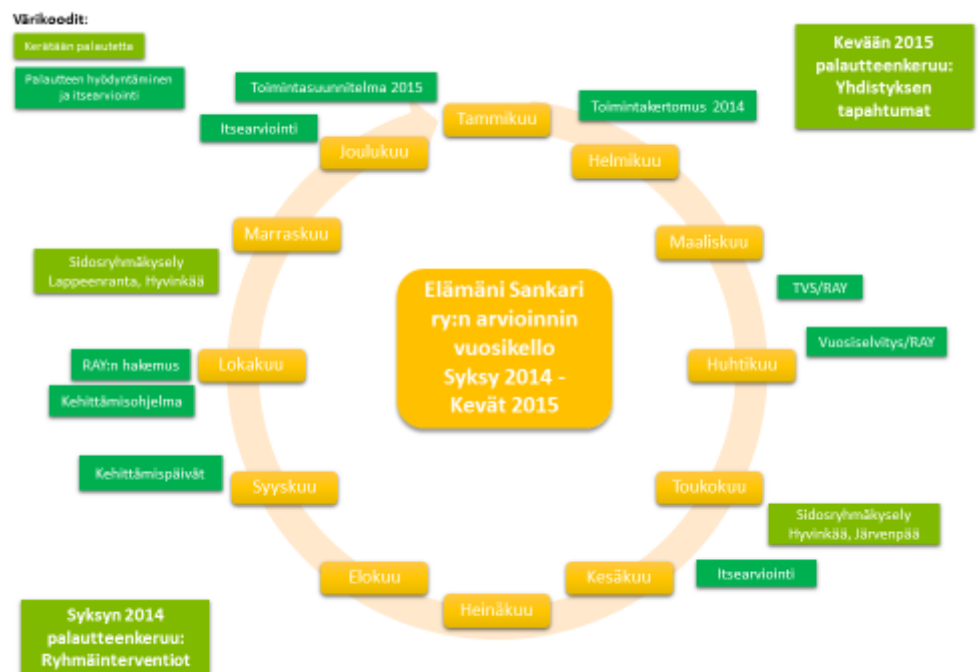
Kuva 10. Järjestömmä arvioinnin vuosikello

Lisäksi itsearviointissa teimme suuren ryhtiliikkeen. Kävimme työyhteisönä sekä hallituksenkin kanssa perusteellisesti läpi toimintamme onnistumisia, haasteita ja kehittämistoimenpiteitä. Käymme läpi saman arviointilomakkeen vuonna 2015, jolloin näemme konkreettisesti, millä saralla olemme edistyneet ja mikä asiakokonaisuus kaipaa puolestaan enemmän kehittämistä.