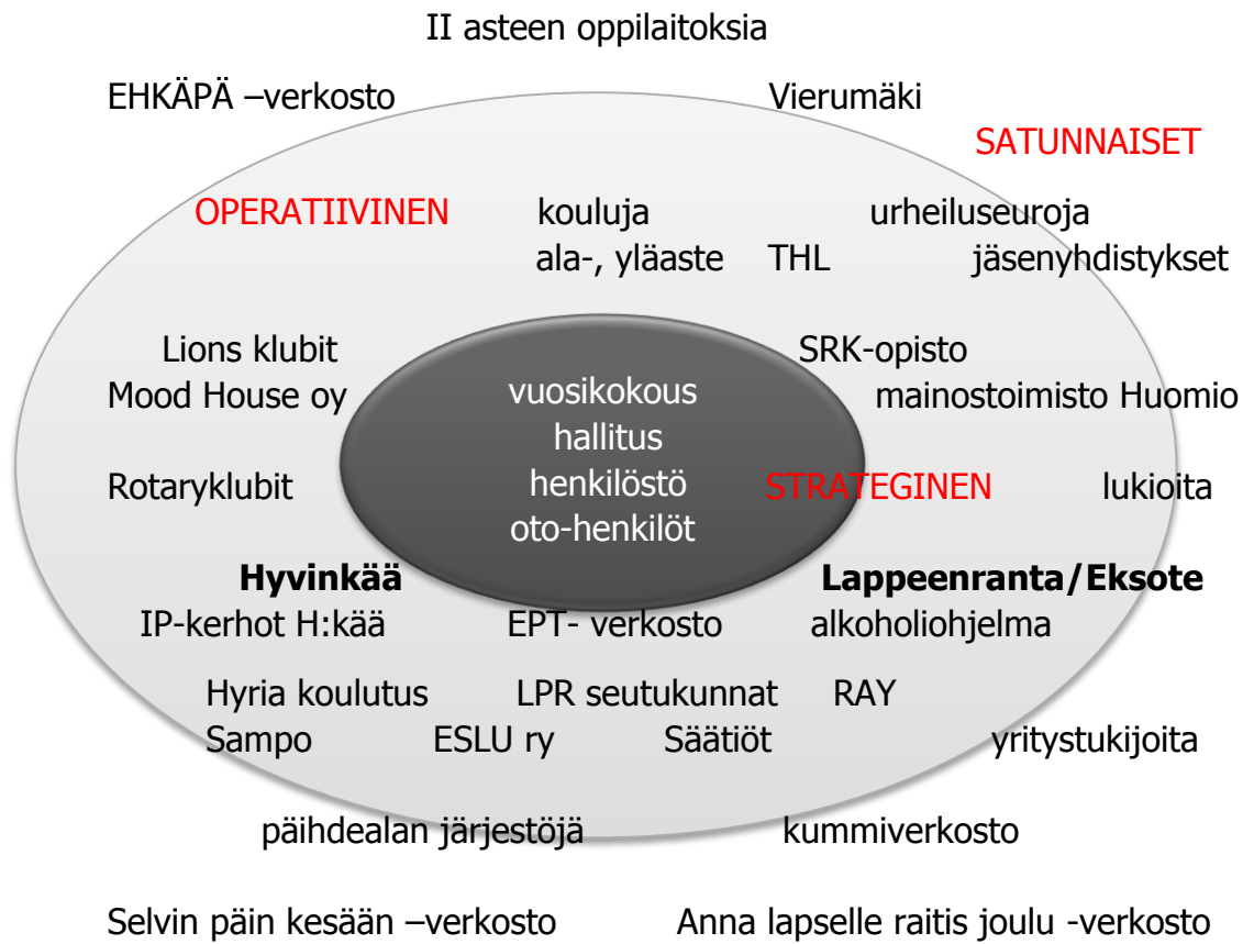
Kuva 2. Toimijaverkostoamme vuonna 2014