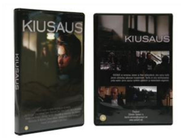
lyhytelokuva Kiusaus 2012

Materiaalejamme myytiin vuoden aikana kymmenittäin ja niiden avulla tavoittamamme ihmisten määrät nousevat huomattavan paljon.