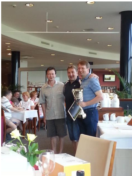
Kuva 8. Lappeenrannan joukkue uusi mestaruutensa vuonna 2014

Toinen merkittävä oma tapahtumamme on perinteinen Sankarigolftapahtuma. Kesällä 2014 kilpailu pelattiin nyt jo XII kerran Kytäjän upeilla kentillä. Tapahtuma on järjestömme varainhankintaa ja se on suunnattu erityisesti yritysasiakkaille.