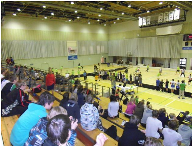
Kuva 9. Sankarisählyturnaus käynnissä Lappeenrannan Urheilutalolla keväällä 2014

Keväällä 2014 toteutimme Lappeenrannan tapahtuman yhteistyössä Raittiuden Ystävät ry:n kanssa ja osana Selvin päin kesään kampanjaa. Tapahtumassa oli mukana parikymmentä joukkuetta ja kaikkiaan noin 400 nuorta. Kokeilu oli onnistunut ja aiomme jatkaa kyseistä yhteistyötä myös vuonna 2015.