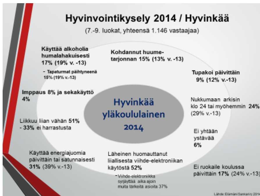
Kuva 5. Hyvinkään kaupungin yläkoulujen hyvinvointikyselyiden koonti

Toimintaa rahoitettiin RAY:n avustusosuudella, kuntien avustusosuudella, koulujen omavastuilla ja Raija ja Ossi Tuuliaisien säätiön toiminta-avustuksella (Eksote/seutukunnat).