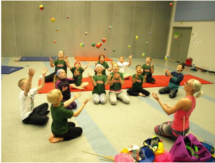
Kuva 7. Sirkustelu oli yhtenä uutena lajina kesän leireillämme

Toinen merkittävä oma tapahtumamme on perinteinen Sankarigolftapahtuma. Kesällä 2014 kilpailu pelattiin nyt jo XII kerran Kytäjän upeilla kentillä. Tapahtuma on järjestömme varainhankintaa ja se on suunnattu erityisesti yritysasiakkaille.