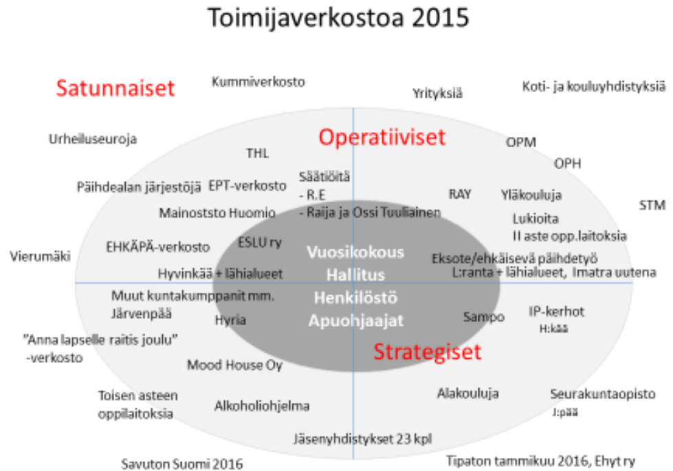
Kuva 3. Toimijaverkostoamme vuonna 2015

Järjestömme toiminta on pääosin paikallista ja alueellista toimintaa, joka painottuu Hyvinkäälle + sen lähialueisiin sekä Lappeenrantaan + Eksoten alueelle. Hyvinkäällä kuulumme mm. kaupungin NuPa- ja HoPe -tiimeihin jäsenenä, joissa vaikutamme nuoriin kohdistuviin asioihin. Toimintamme huomioidaan Hyvinkäällä hyvin ja esim. hyvinvointikyselymme liitetään mukaan kaupungin tuottamaan vuosittaiseen hyvinvointikertomukseen. Loppuvuodesta saimme myös kutsun perustettavaan EHKÄPÄ moniammatilliseen työryhmään yhdeksi asiantuntijajäseneksi. Tämän työryhmän toiminta alkaa vuoden 2016 alussa ja se liittyy uuden lain ehkäisevästä päihdetyöstä käytännön toteutukseen.