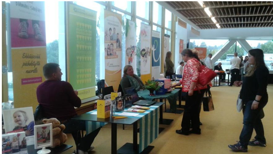
Kuva 9. Ehkäisevän työn päivillä Kuopiossa

Tämän vuoden tapahtumissa mukanaoloamme leimasi henkilökunnan tietojen ja taitojen päivittäminen verkostoitumisen lisäksi. Koimme kaikki tilaisuudet oikein hyviksi, joista oli järjestöllemme hyötyä.