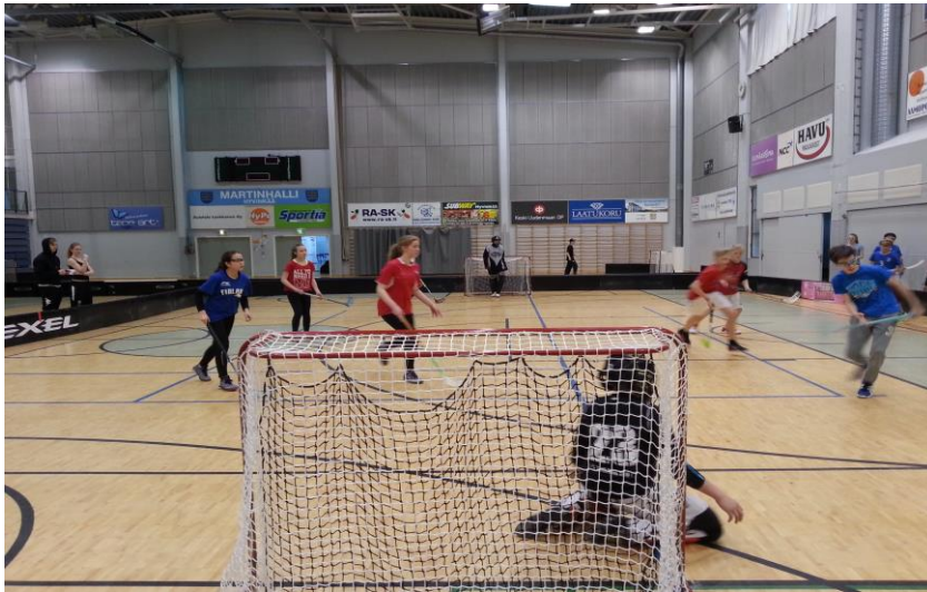
Kuva 8. Pelin tuoksintaa Hyvinkään sankarisählystä Martin liikuntahallilta

Yhteenvedona näistä liikunnallisista tapahtumista voi sanoa, että niillä on vankka sijansa järjestöme toiminnassa. Tapahtumien merkitys on tärkeä ja niillä on osaltaan vaikutusta yksilöiden päivittäiseen liikkumiseen. Kuluvana vuonna lasten ja nuorten liikkumattomuudesta sekä liiallisen istumisen haitoista puhuttiin enemmän kuin koskaan. Nuoret on saatava varhemmin liikkeelle ja liikkumisesta olisi saatava elämäntapa. Kansanterveyden näkökulmasta asia on juuri näin, mutta uusia toimia tarvitaan. Tulevaisuudessa uskomme näiden tapahtumien merkityksen kasvavan entisestään.