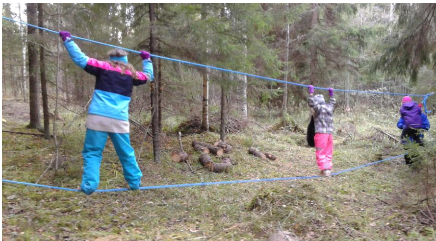
Kuva 6. Syyslomaleirin seikkailupäivän tunnelmissa