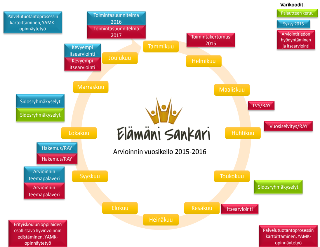
Kuva 11. Arvioinnin vuosikellomme