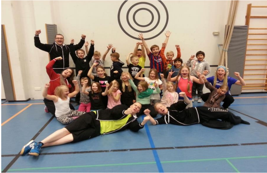
Kuva 5. Syyslomaleiriläiset voittajafiiliksissä

Pääyhteistyökumppanimme ensimmäisellä syyslomaleirillä oli Hyvinkään kaupunki, aluehallintovirasto, HPP law ja Sankarigolf kilpailuun 2015 osallistuneet yritysjoukkueet.