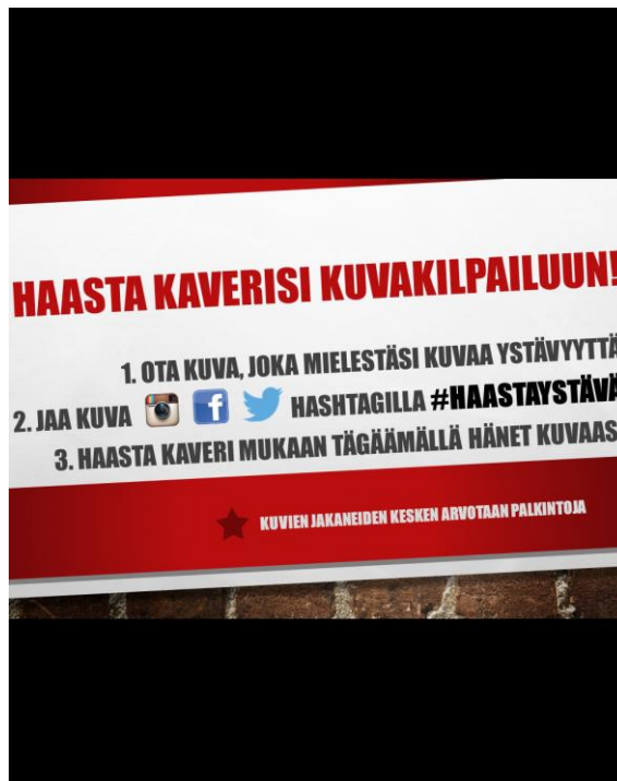
Kuva 10. Järjestömme ensimmäisen Instagram -kilpailun ohjeistus Sveitsin lukion teemapäivässä

Viestintäämme ohjasi toimintasuunnitelman mukana kulkenut viestintäsuunnitelma, joka helpotti käytännön toteutusta.